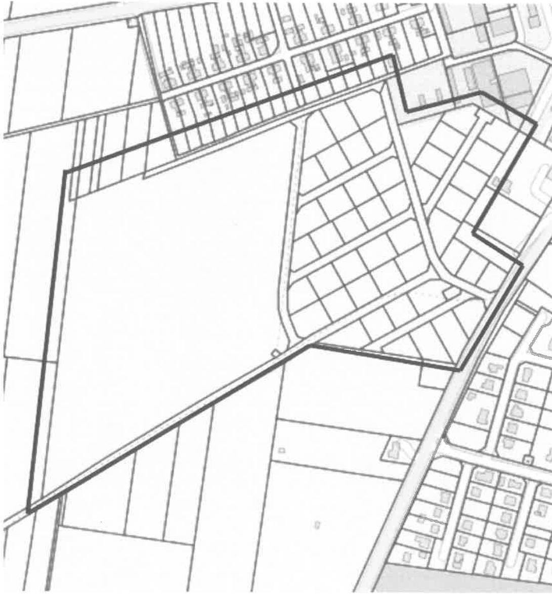
— Poglądowa lokalizacja terenów objętych miejscowym planem